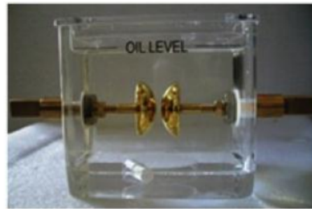
Gambar 1. Konfigurasi elektroda berdasarkan standar IEC - 60156

Gambar 1 berikut ini. Bejana pengujian dihubungkan ke tegangan tinggi dengan pengaturan kenaikan tegangan secara perlahan dan hati-hati sekitar 2kV/s sampai terjadi tembus listrik.